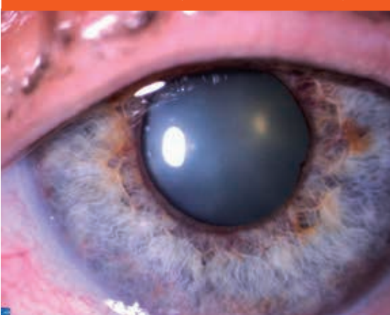
Obr. 1. Rubeóza dúhovky