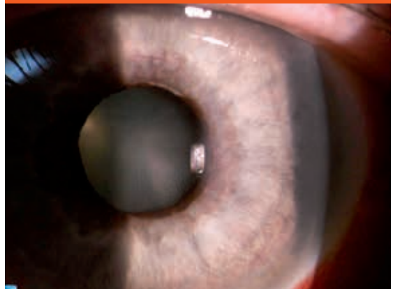
Obr. 3. Ektropium pigmentového listu dúhovky (archív II. Očnej kliniky SZU)

zrenice. Tieto nemusia byť pri vyšetrení štrbinovou lampou vo včasnom štádiu viditeľné. Pod vplyvom ďalšej koncentrácie VEGF dochádza ku vzniku fibrovaskulárnej membrány pokrývajúcej povrch dúhovky a rozširujúcej sa smerom do uhla, ktorého štruktúry prekrýva (obr. 2).