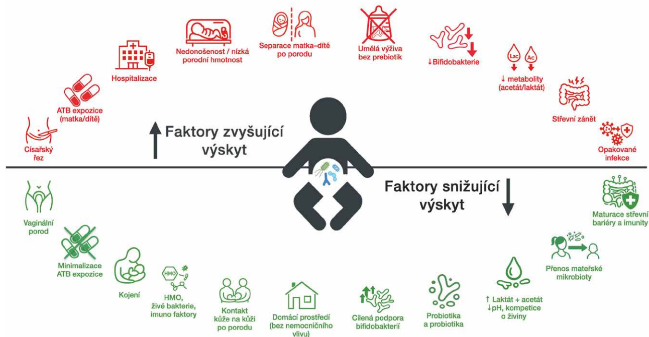
Obr. 2. Faktory ovlivňující výskyt Klebsiella spp. ve vyvíjející se střevní mikrobiotě

Kolonizace střev v kojeneckém věku hraje klíčovou roli v rozvoji imunitní tolerance a vývoji regulačních mechanismů imunitního systému [32]. Dysbalance střevní mikrobioty v raném období života může negativně ovlivnit zránění imunitního systému a v pozdějším