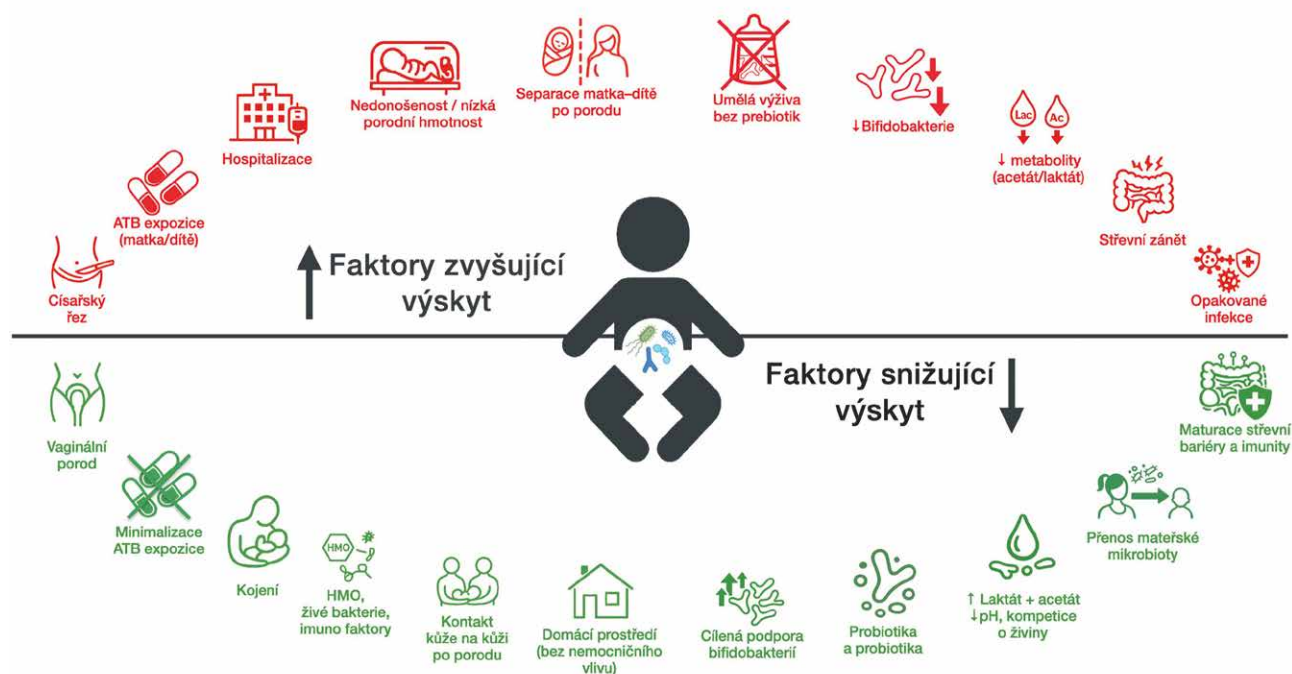
Obř. 2. Faktory ovlivňující výskyt Klebsiella spp. ve vyvíjející se střevní mikrobiotě

Kolonizace střev v kojeneckém věku hraje klíčovou roli v rozvoji imunitní tolerance a vývoji regulačních mechanismů imunitního systému [32]. Dysbalance střevní mikrobioty v raném období života může negativně ovlivnit zránění imunitního systému a v pozdějším