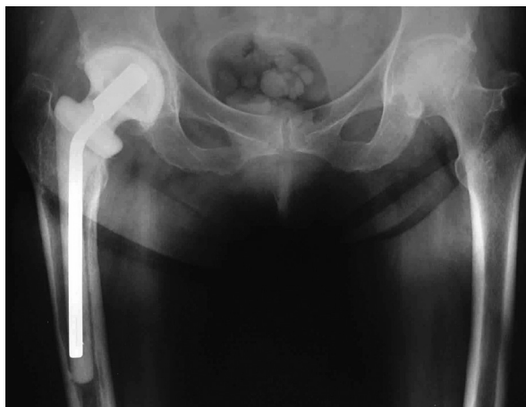
Obr. 1. Rentgenový snímek implantovaného ready-made spaceru kyčelního kloubu Významnou výhodou je zachování délky končetiny. Fig 1. An X-ray of an implanted ready-made total hip spacer, having the advantage of preserving limb length

Ve studii byly použity spacers vyrobené z vysoce porózního kostního polymethylmetakrylátového cementu impregnovaného gentamicinem – Synamic® (obr. 1 a 2). Kyčelní spacer obsahuje 2,12 g gentamicinu, obsah gentamicinu v kolenním spaceru je 3,38 g. Podle výrobce spacers Synamic® vykazují bifázický profil uvolňování antibiotika – po iničiálním uvolnění vysokých koncentrací (koncentrační vrchol je mezi 24–48 hodinami) následuje fáze nižšího, postupného uvolňování antibiotika do okolí spaceru. Spacers kyčelního kloubu a kolenního kloubu jsou z mechanického hlediska navrženy tak, aby vydržely in situ minimálně 6 měsíců [9].