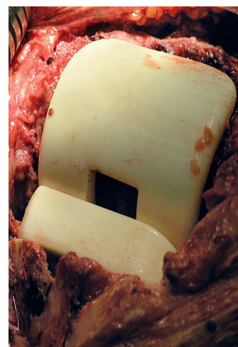
Obr. 2. Peroperační snímek implantovaného kolenního spaceru Synamic® Fig 2. Perioperative photo of an implanted Synamic® knee spacer

K reimplantaci nové TEP se přistoupilo ve chvíli, kdy měl pacient opakovaně negativní laboratorní markery zánětu (FW, CRP) a negativní klinický nález (chybění známek zá-