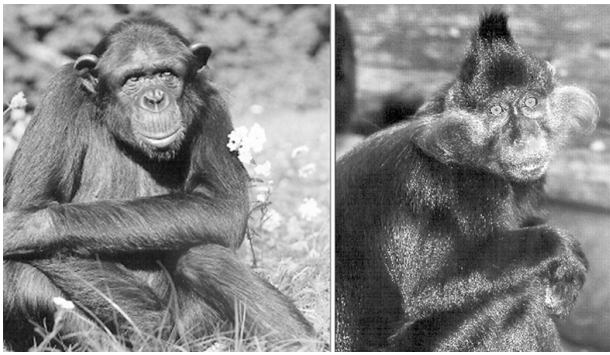
Obr. 5. Bezpříznakoví nosiči HIV u opic ze Subsaharské Afriky – HIV-1: Šimpanz učenlivý (respektive poddruh Pan troglodytes troglodytes ), HIV-2: Mangabey černý ( Cercocebus aterrimus )

Fig. 5. Asymptomatic HIV carriers, non-human primates from sub-Saharan Africa HIV-1: Central common chimpanzee ( Pan troglodytes troglodytes ) HIV-2: Black mangabey ( Cercocebus aterrimus )