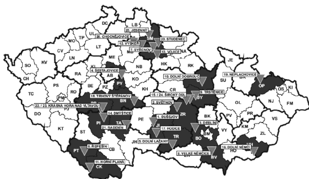
Obr. 2. Pozitivní nálezy BSE v České republice k 5. 12. 2006 zdroj: Státní veterinární správa České republiky (www.svscrcz)