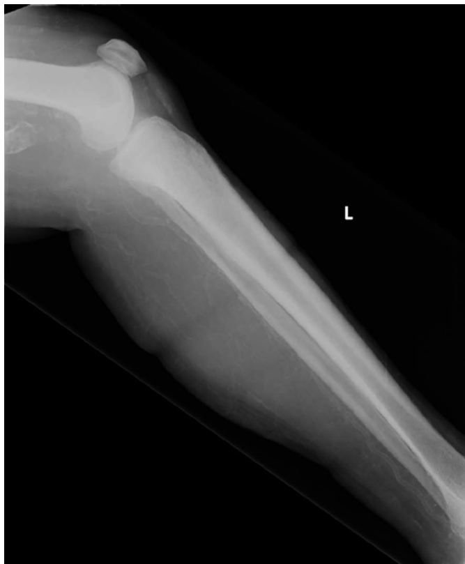
Obr. 1. Mediokalcinóza

Na nativním rtg snímku postižené oblasti (zde jde o bérce) je patrná kalcifikace tepen až do úplné periferie, jedná se o kalcifikace hladké cévní svaloviny. Mediokalcinóza může, ale nemusí být provázena kalcifylaxí. Pacienti s kalcifylaxí však mají v dané oblasti mediokalcinózu vždy.