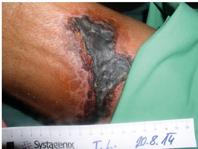
Obr. 4. Ložisko kalcifylaxe