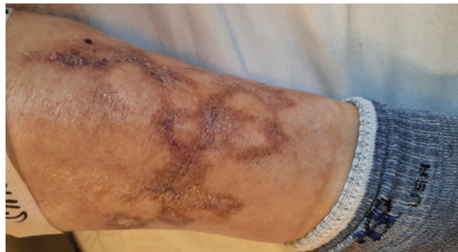
Obr. 5. Iniciální kalcifylaxe

Pacient 4 – Pacient byl sledován v predialyzační nefrologické ambulanci pro pokročilou chronickou onemocnění ledvin, dosud bez nutnosti zahájení dialyzační léčby a bez známek uremie. Pro vysokou koncentraci PTH mu byl předepsán parikalcitol. Po několika týdnech této terapie se dostavil s náhle vzniklými, výraznými a spontánními bolestmi lýtky, doprovázenými změnami barvy kůže. Klinický obraz byl vyhodnocen jako iniciální kalcifylaxe v kontextu již pokročilé renální insuficience s hyperfosfatemii a současně terapií aktivním vitaminem D. Souběžně pacient užíval warfarin. Léčba parikalcitolem i warfarinem byla ihned ukončena. Přetrvávající hyperfosfatemie vedla k zahájení dialyzačního programu s cílem dosáhnout normofosfatemie. Do terapie byl vřazen thiosulfát. Kožní nález se následně zcela zhojil. Později byl pacient úspěšně transplantován. Publikováno (10).