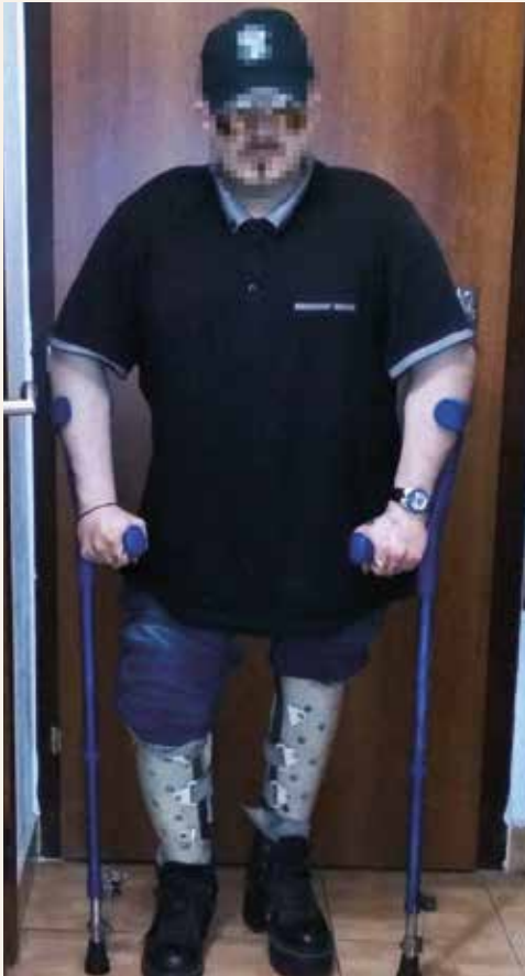
Obr. | Pacient (brat)