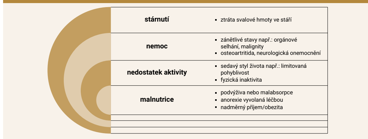
Schéma 1 | Znázornění příčin sarkopenie. Upraveno podle [2]

ASM – Appendicular Skeletal Muscle Mas SPPB – Short Physical Performance Battery TUG – Timed-Up and Go test