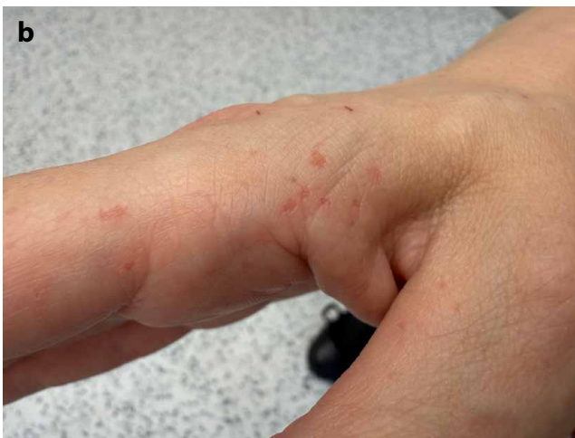
Obr. 5a, b. Vícečetné palmární jamky včetně bočních partií prstů u matky pacienta

Pacient je nadále sledován dermatologem, stomatologem a kardiologem. Histopatologicky byl dosud potvrzen nodulární BCC, mikronodulární BCC a trichoblastom. Provedená magnetická rezonance mozku vyloučila primární mozkový nádor.