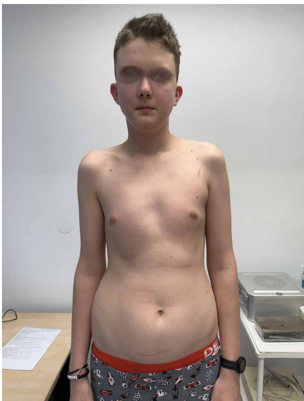
Obr. 1. Celková fyziognomie pacienta

Provedena byla probatorní excize ze suspektního projevu v oblasti pravého obočí, histopatologicky byl verifikován mikronodulární bazocelulární karcinom (BCC) a patologem byla vyjádřena suspekce na Gorlinův-Goltzův syndrom vzhledem k nízkému věku