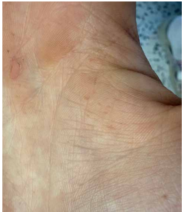
Obr. 2. Vícečetné palmární jamky