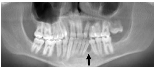
Obr. 4. Rentgenový snímek čelistí pacienta s přítomností odontogenní cysty mandibuly (šipka)

Vzhledem k výše popsaným příznakům a rodinné anamnéze bylo u pacienta vyjádřeno podezření na diagnózu Gorlinova-Goltzova syndromu. Následné genetické vyšetření potvrdilo heterozygotickou patogenní mutaci genu PTCH1 v lokusu 708G > A, čímž byla suspekce na tento syndrom potvrzena. Stejná genetická aberace byla následně potvrzena u matky pacienta. Genetickému vyšetření se též podrobila babička a sestra pacienta. U obou byla tato genetická aberace vyloučena.