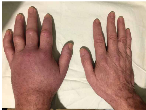
Obr. 7. Artritida u pacienta se syndromem VEXAS