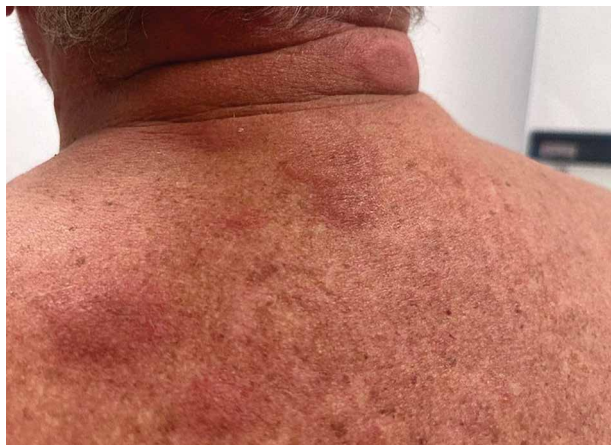
Obr. 2. Neutrofilní dermatóza u pacienta se syndromem VEXAS

Kožní projevy jsou nejčastější orgánově specifickou manifestací syndromu VEXAS, vyskytující se u 88 % pacientů. V 63 % případů je kožní postižení prvním příznakem onemocnění [15]. Závažnost a charakter kožních projevů se mění v čase s obdobími relapsů a remisí [18]. Typická je rovněž velmi dobrá reakce kožních projevů na systémové glukokortikoidy [15]. Nejčastější kožní manifestací jsou mnohočetná, erytematózní, edematózní ložiska připomínající Sweetův syndrom (Sweet syndrome-like), s maximem na trupu a končetinách (obr. 2) [3, 18].