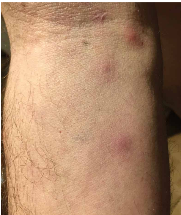
Obr. 4. Makulopapulózní exantém u pacienta se syndromem VEXAS