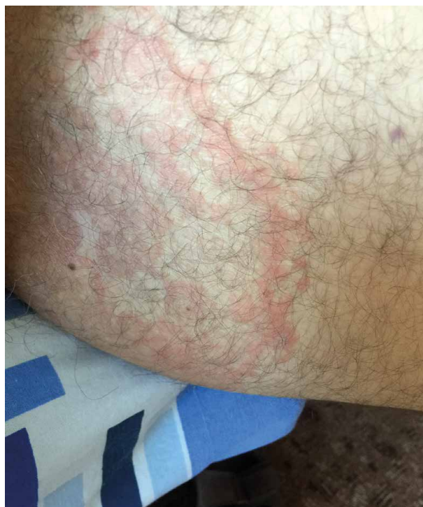
Obr. 5. Mapovitý erytém u pacienta se syndromem VEXAS

vzácněji zasahují až do hypodermis. Diferenciálně diagnosticky může pomoci skutečnost, že léze u syndromu VEXAS obvykle nejsou bolestivé, i když vzácněji se vyskytla jak bolestivost, tak svědivost [18].