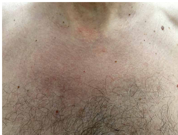
Obr. 6. Plošný erytém u pacienta se syndromem VEXAS

U pacientů jsou relativně časté vaskulitidy (dle některých autorů stejně časté jako neutrofilní dermatózy [17]), postiženy mohou být cévy jakéhokoliv kalibru. Mohou klinicky imponovat jako polyarteritis nodosa nebo kožní vaskulitida [17]. Nejčastější je leukocytoklastická vaskulitida, nicméně dle některých prací mají kožní léze v histologickém obraze vysoký stupeň leukocytoklasie, bez přítomnosti fibrinoidní nekrózy, a nespĺňují tedy kritéria pro diagnózu leukocytoklastické vaskulitidy [18]. Tato „perivaskulární dermatitida“ se klinicky projevuje purpurou a bývá též častým projevem syndromu VEXAS [17]. Postižení pojivové tkáně zahrnuje artralgie nebo artritidy a chondritidy (obr. 7).