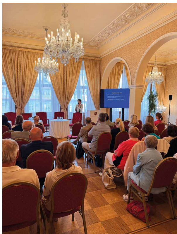
Sál se rychle zaplnil