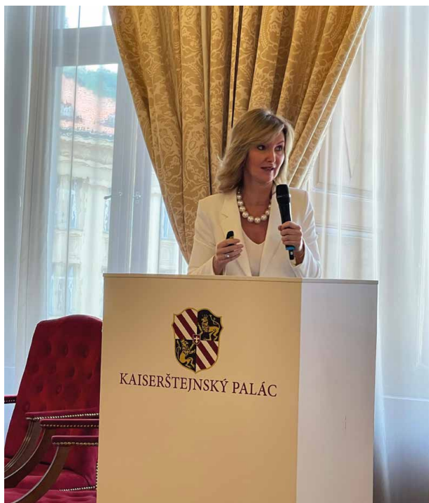
Choroby vlasů nesmíme přehlížet

nabízí celou řadu možností, jak i tyto choroby úspěšně zvládat. Vše bylo dokumentováno na úrovni evidence-based medicine i kazuistickými příklady. Její přednáška „Nechme na hlavě“ tak i zatím nepřesvědčeného posluchače ubezpečila o tom, že chybění vlasů zaručeně není jen vadou na kráse.