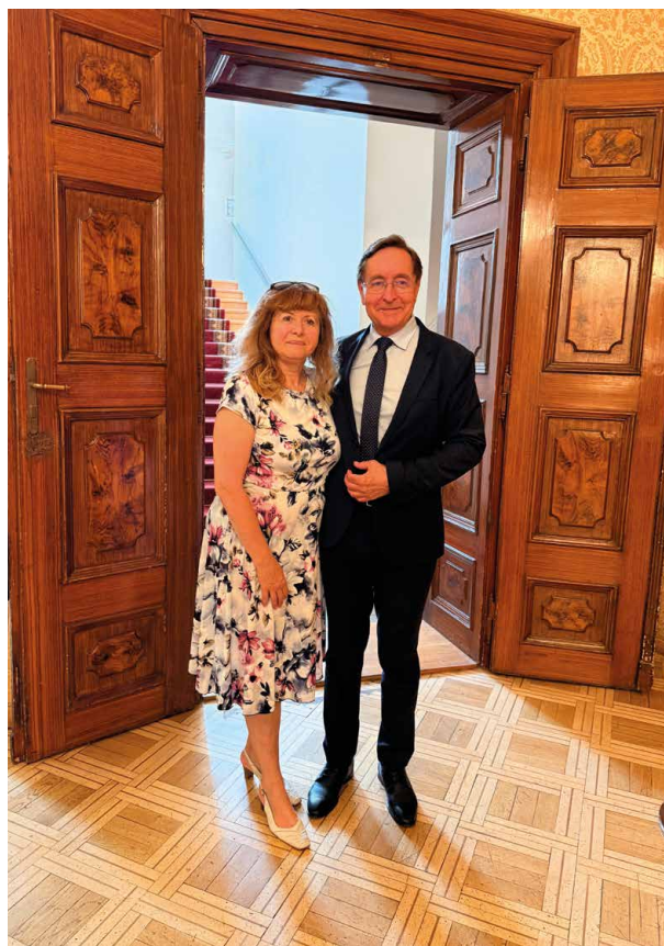
Představitelé pořadatelů semináře