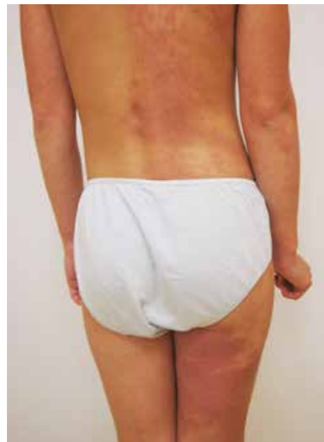
Obr. 8. V šesti letech věku (foto 3–8 archiv Dermatovenerologické kliniky FN Plzeň)