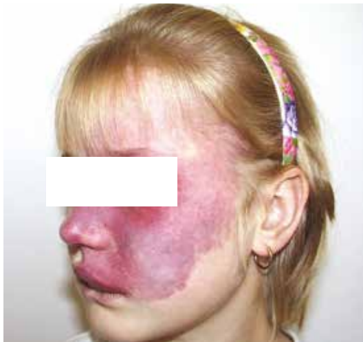
Obr. 12. Sturge-Weber syndrom

nežádoucí účinky dle SPC jsou gastrointestinální potíže (nevolnost, zvracení, průjem), snížená chuť k jídlu, zvýšená únava, kožní vyrážka, elevace kreatininu, lipázy, GGT, ALT, snížení lymfocytů, anemie.