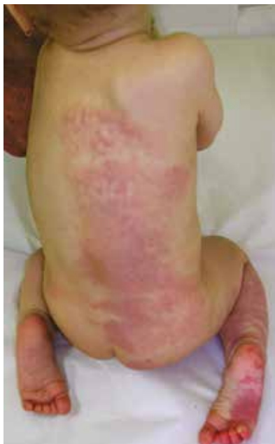
Obr. 7. Ve třinácti měsících