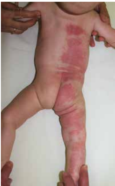
Obr. 6. Dívka z třetí kazuistiky ve čtyřech měsících