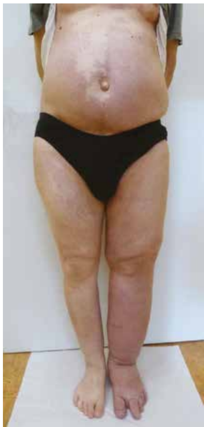
Obr. 3. Klinický náález KTS u pacienta z druhé kazuistiky

Na lymfoscintigrafickém vyšetření provedeném s aplikací lymfotropního radiofarmaka do podkoží v 1. a 3. meziprstí se povrchový mízní systém PDK spolehlivě