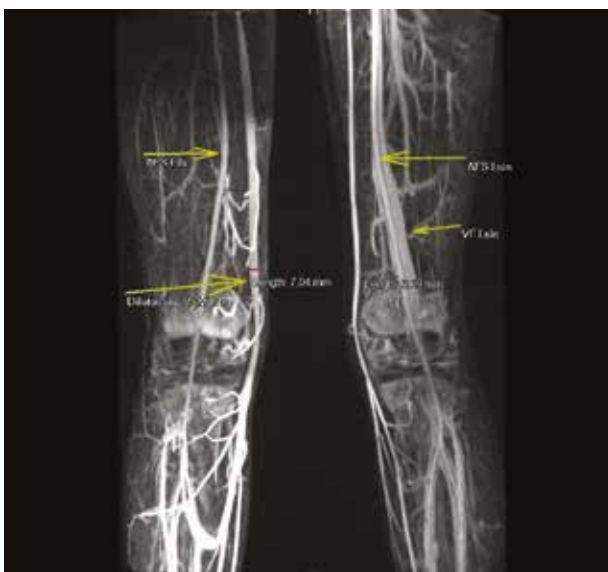
Obr. 9. MRA s nálezem dilatovaná VSM a chybějící VF a VP na PDK

pro rozsáhlý naevus flammeus, který byl přítomen od narození na kůži PDK a trupu. V provedených vyšetřeních (pediatrické, oční, genetické, sonografické včetně CNS a vnitřních orgánů) nebyla popsána žádná patologie. Pouze sonograficky byl na cévách PDK zmíněn nepřesně hodnotitelný nález, který předpokládal anatomické anomálie žilního systému, eventuálně A-V malformace.