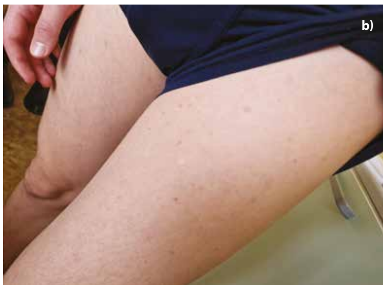
Obr. 5b. Stejný pacient po 3měsících trvající fototerapii NB-UVB