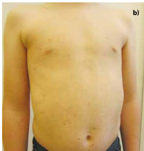
Obr. 6b. Mírnější recidiva projevů 2 měsíce po ukončení fototerapie