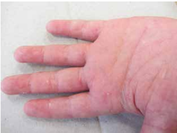
Obr. 9. Solitární projev PL v dlani

Subjektivně bývá pociťováno mírně svědění, nebo jsou projevy asymptomatické, zřídka bolestivé či výrazně svědicí. Celkové příznaky jsou ojedinělé a mírné – febrilie (6 %) a bolesti kloubů (3 %).