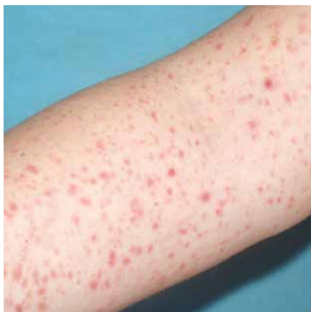
Obr. 3. 5letý chlapec s 8 měsíců trvajícím makulopapulózním výsevem, posléze přecházejícím do ojedinělých krust. Histologie neprovedena.