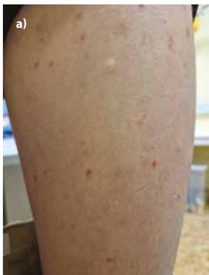
Obr. 5a. Pacient po 2měsících trvající fototerapii NB-UVB

Novější práce většinou tyto formy nerozlišují. Projevy mohou být zřídka lokalizovány i ve dlaních a v obličeji, u dětí je obličej postižen méně často než u dospělých (obr. 8, 9). Postižení typicky nebývá ve křtici.