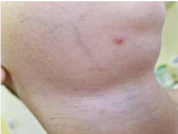
Obr. 8. Ojedinělý projev PL v obličeji