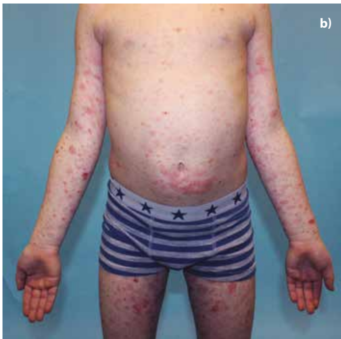
Obr. 2. a, b. 7letý chlapec s 2 měsíce trvajícím projevem, histologie PLEVA