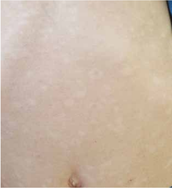
Obr. 7. 6letý chlapec, 2 měsíce trvající onemocnění, remise papul do hypopigmentací spontánně po letních měsících