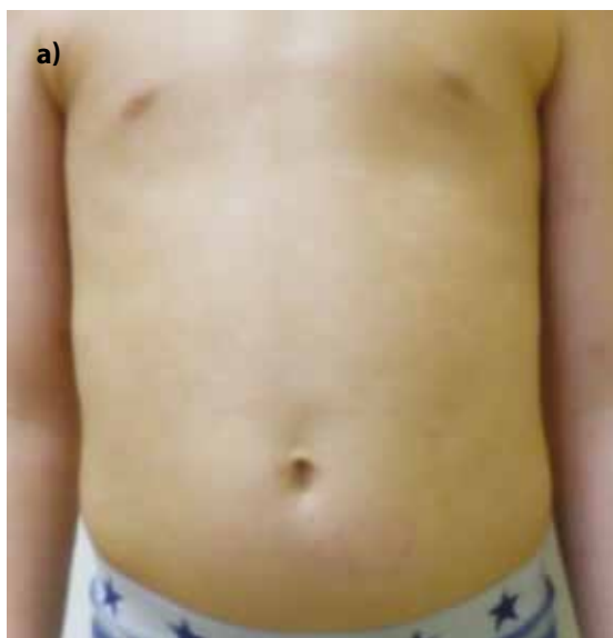
Obr. 6a. Pacient z obrázku 2 po 2měsíční fototerapii NB-UVB perzistují nenápadné hypopigmentace