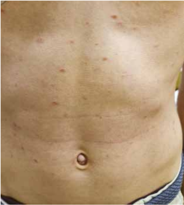
Obr. 1. 14letý chlapec se 7 měsíců trvajícím projevem Histologie prokázala PLEVA, klinicky bez krust, stav po 2 měsících fototerapie NB-UVB.