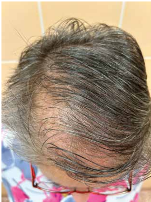
Obr. 3. Pacientka FAGA I. stadia podle Ludwiga, léčba 100 mg verospironu denně Stav po pěti letech od začátku léčby (původní stav FAGA II. stadia dle Ludwiga).

Perorální cyproteron acetát (CPA) lze považovat za prevenci progresu FAGA u žen s klinickými nebo biochemickými známkami hyperandrogenismu. CPA je