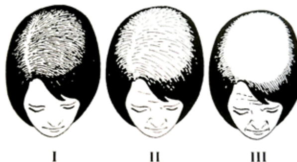
Obr. 2. Ludwigova klasifikace tíže FAGA [11]