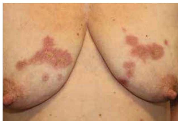
Obr. 2. Necrobiosis lipoidica na trupu

Diseminovaná perforující necrobiosis lipoidica je vzácnou formou rozsáhlejšího onemocnění spojená