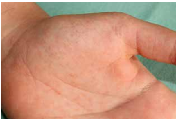
Obr. 4. Typický výsev drobných punktátních keratóz na kůži dlaně

Charakteristické je postižení dlaní a plosek , které se vyskytuje až u 96 % nemocných. Na kůži tlustého typu rukou a nohou se tvoří punktátní keratózy ve formě mnohočetných jamek či papulek, které mohou přerušovat papilární linie (obr. 4). Tíže postižení dlaní převažuje nad postižením plosek. Vzácněji vznikají ostře ohraničená silná ložiska keratodermie v centrální části dlaní, na ploskách v místech nejvyšší tlaku s případným vznikem fisur [88]. V několika případech byl zaznamenán výskyt palmoplantárního postižení ve formě mnohočetných hyperortokeratotických filiformních („spiny“) hy-