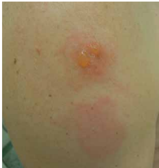
Obr. 2. ET pozitivní nahore: 1,6-Hexandiol diakrylát +++/++++ dole: Methyl metakrylát +++/+++

Příčinami kontaktního alergického ekzému však bývají zcela běžné alergeny, o to obtížněji je lze někdy odhalit.