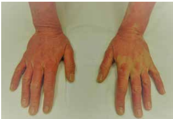
Obr. 1. Eczema contactum allergicum manum (tiskárna – UV tvrzené akrylátové barvy)

Všechny kožní nemoci z povolání hlášené v roce 2017 uvádí tabulka 2. Počet může být i vyšší, neboť u některých infekčních nemocí může jít i o další kožní lokalizace, což statistická data vysloveně neuvádějí (mohlo by jít například o tuberkulózu kůže).