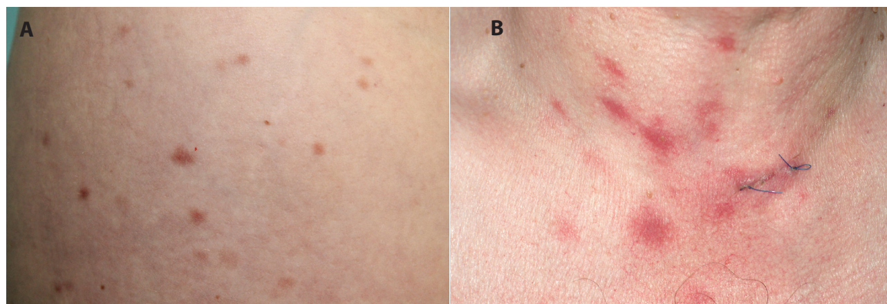
Obr. 2. Urticaria pigmentosa

a) Červenohnědé makulopapuly o velikosti několika mm