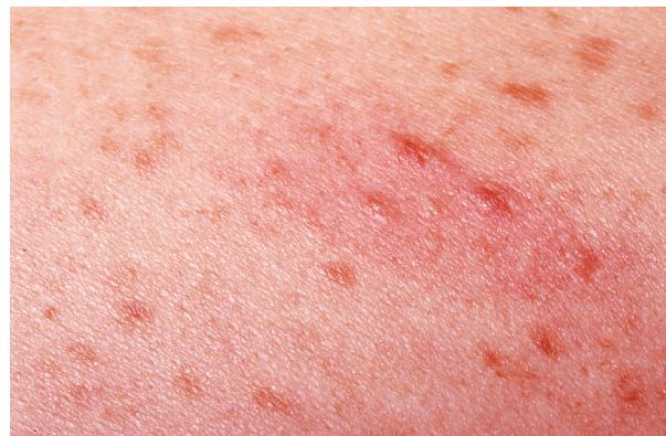
Obr. 1. Dariérův příznak – zduření projevů a erytém

Je nejčastější kožní manifestací onemocnění u dětí i dospělých (50–75 %). Makuly a papuly jsou velikosti několik milimetrů až centimetrů (obr. 2B), červenohnědé barvy. Mohou být přítomny na celém těle, většinou s vynecháním dlaní a chodidel. Objevují se v počtu desítek až stovek, někdy jsou dokonce splývající. Vysévají se často v průběhu několika měsíců, méně často přibývají léta. Mohou mít purpurický charakter, někdy se tvoří puchýře