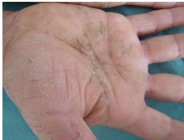
Obr. 5. Chronická iritační kontaktní dermatitida na dlaních po pracovních rukavicích