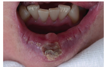
Obr. 3. Ulcerózní spinocelulární karcinom dolního rtu krytý krustou (T1), indikovaný svou velikostí ke klínovité excizi