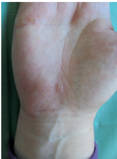
Obr. 1a, b. Hyperkeratotické papule

du 2011 musela být ukončena pro komplikace – cheilitis sicca a zvýšení transamináz. Opakované histologické vyšetření v roce 2012 popsalo vkleslinu kožního povrchu o průměru 3 mm vyplněnou hyperkeratotickým čepem, na spodině mírně akantotickou epidermis (obr. 2). Tento histologický nález odpovídal klinické diagnóze punktátní keratodermie. Při hospitalizaci na kožním oddělení v roce 2014 byl nasazen lokální isotretinoin a vazelína s 10 % salicylové kyseliny, po kterých se kožní nález podstatně zlepšil. Tato léčba pokračuje spolu s pravidelnou pedikérskou péčí – obrušováním frézou, změkčováním