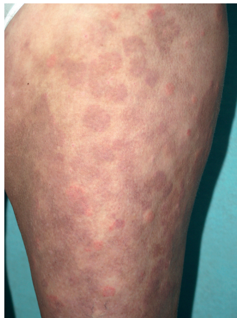
Obr. 1. Urtikariální vaskulitida

Mimo zmíněné se do této zvláštní skupiny kopřivkových syndromů řadí též Gleichův syndrom (epizodický angioedém s eozinofilií) a Wellsův syndrom (granulomatózní dermatitida s eozinofilií), urticaria pigmentosa, cvičením (námahou) indukovaná anafylaxe a konečně i klasická urtikariální vaskulitida . Histologicky se jedná o leukocytoklastickou vaskulitidu (leukocytární infiltrát s rozpadajícím se jádrem, fibrinoidní nekróza cévní stěny), kopřivkové projevy trvají déle než 24 hodin, spíše pálí než svědí, často má hemoragický charakter, může zanechávat pozánětlivé erytémy či pigmentace (obr. 1) a angioedém ji doprovází naprosto výjimečně. Může provázet systémový lupus erytematosus, Sjögrenův syndrom, kryoglobulinémii či hypokomplementémii.