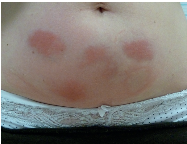
Obr. 2. Reakce v místě aplikace injekcí anakinry u pacientky léčené pro HIDS

Monogenní syndromy vznikají na podkladě mutací genů pro proteiny vrozené imunity, které jsou součástí NLRP3 inflammasomu, cytokinových receptorů či jejich antagonistů, nejčastěji jde o geny pro pyrin a TNF receptory. Výsledkem mutací je porušená regulace vrozené imunity s abnormální aktivitou interleukinu 1 \beta a přetrváváním leukocytů ve tkáních, takže i mírné podněty pak mohou vyvolat nepřiměřenou zánětlivou reakci. Laboratorně