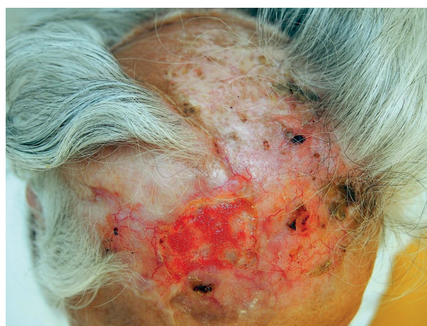
Obr. 2b. Klinický nález před zahájením léčby (červen 2014)