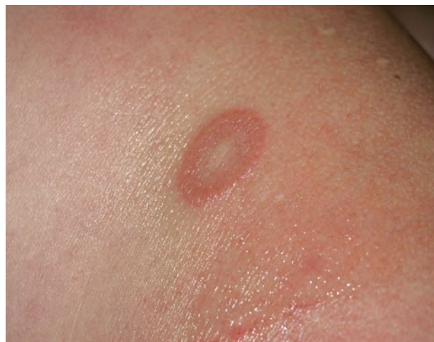
Obr. 2. Granuloma anulare – anulárního ložisko