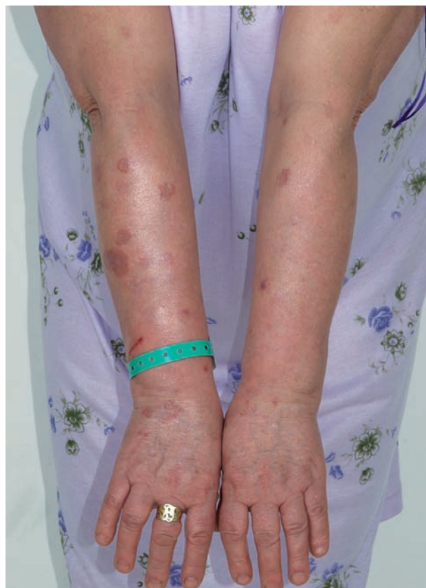
Obr. 1. Granuloma anulare – mnohačetná anulární ložiska

ních i dolních končetinách, v 5 % jen na trupu a přibližně v 5 % ve všech lokalitách. Na obličejí jsou projevy zřídka. Ložiska jsou barvy kůže, růžová, nebo fialová, okraj ložisek je složený z jednotlivých drobných, několikamilimetrových papul, v centru obloukovitých až anulárních ložisek je intaktní kůže (obr. 2). Anulární ložisko má zpravidla průměr několika centimetrů. Solitární papuly s centrální depresí v úrovni kůže (papulárně-umbilikální forma) nebo noduly se nejčastěji vyskytují na prstech. Lokalizovaná forma GA se objevuje nejčastěji u pacientů do 30 let věku, 2krát častěji u žen [2].