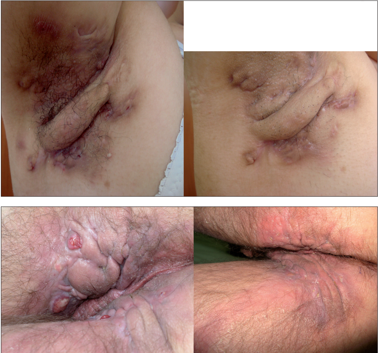
Obr. 1A, 1B. Hidradenitis suppurativa s axilárním a perianálním postižením před terapií a 4 měsíce po nasazení adalimumabu

Po šesti měsících léčby adalimumabem byla průměrná redukce bolesti o 81 % a průměrná redukce sekrece o 54 %. Stabilizovaný stav onemocnění byl udržován od 6. do 12. měsíce terapie u všech sledovaných. Stabilizovaný stav se začal opět postupně zhoršovat po vysazení terapie během období sledování a u šesti pacientů jsme v této době zaznamenali relaps. Po 24 měsících byla průměrná redukce bolesti o 59 % a redukce sekrece o 48 %.