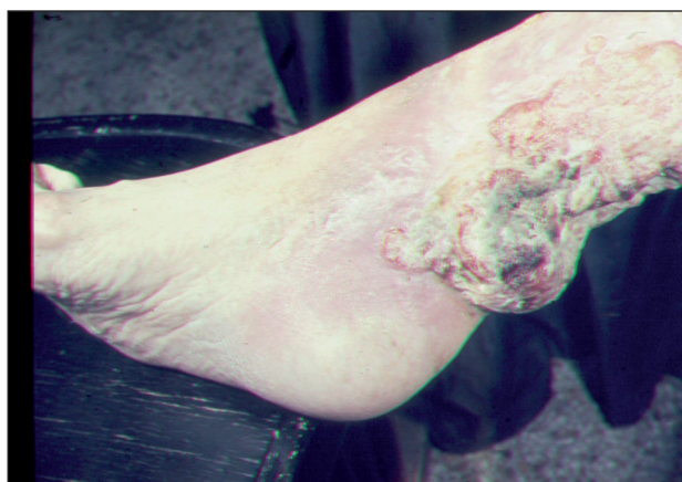
Obr. 10. Ca spinocellulare exulcerans.

Jednou z příčin bérčového vředu je rozpad tumoru. K nejčastějším nádorům, které vyúsťují v ulcerace patří: bazaliom, spinaliom, melanom, Kaposiho sarkom, angiosarkom, mycosis fungoides, metastázy vnitřních malignit do kůže. Na nádorovou příčinu onemocnění je třeba pomýšlet u nehojivých, na obvyklou léčbu nereagujících ulcerací (obr. 10).