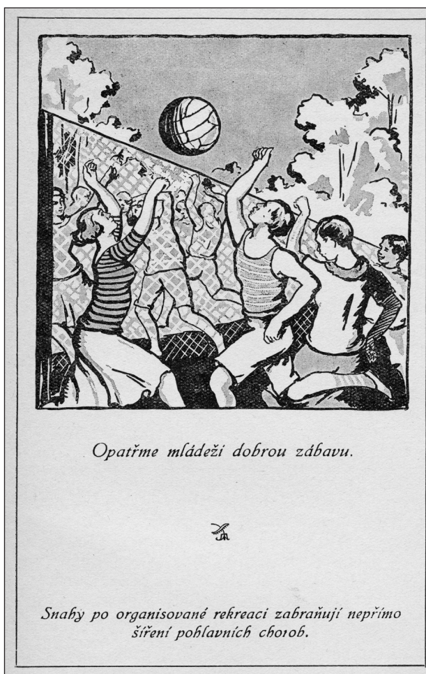
Obr. 5. Příručka pro mládež.

i jejich zveřejňování, si žádala přirozeně publikační možnosti. A tak Šamberger založil záhy časopis Česká dermatologie, jejímž redaktorem byl od konce jejího I. ročníku po dobu 39 let prof. Hübschmann. Časopis vycházel i za okupace (od roku 1947 jako Československá dermatologie), jedině s tím omezením, že v letech 1942–43 vycházely 2 svazky více než jeden rok (4, 8).