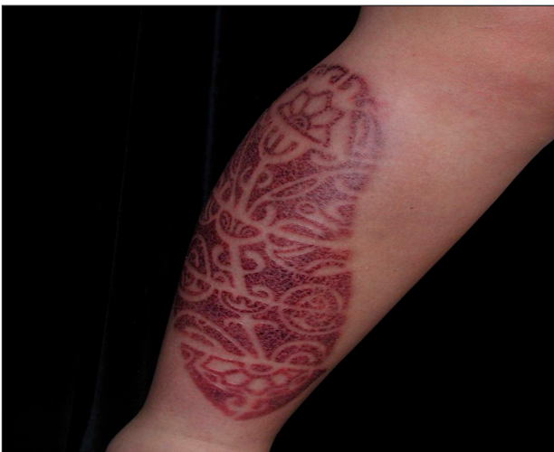
Obr. 5. Kontaktní ekzém na bérce u pacienta č. 2.