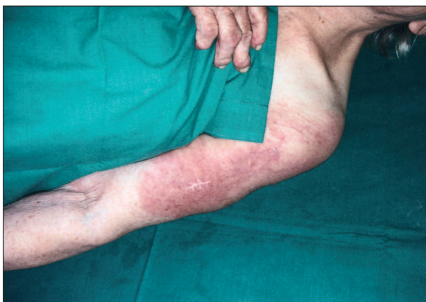
Obr. 4. Klinický obraz RAE (kazuistika č. 2).

Nynější onemocnění: v prosinci 1999 se objevilo a poté se postupně zvětšovalo ložisko červenofialového erytému na levém rameni a zevní ploše levé paže. Ložisko bylo nepravidelného tvaru, velikosti 30x15 cm (obr. 4), relativně ostře ohraničené, bez fluktuace, fokálně mírně infiltrované.