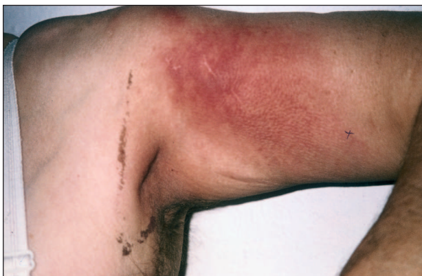
Obr. 1. Klinický obraz RAE (kazuistika č. 1).

Nynější onemocnění: od prosince 1998 docházelo k rozvoji neostře ohraničeného červenavého ložiska přibližně kruhového tvaru o průměru 12 cm na ventrolaterální straně levé paže, které bylo subjektivně asymptomatické (obr. 1). Základní vyšetření prokázalo pouze vyšší sedimentaci erytrocytů a mírnou leukocytózu, sérologie na borelie byla negativní, latex vysoce pozitivní, vyšší CRP.