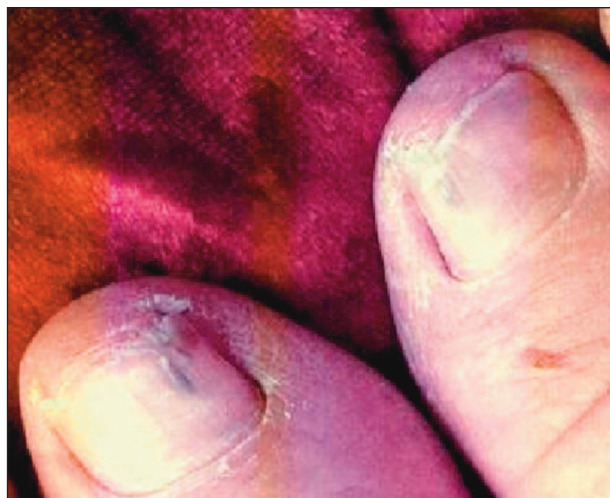
Obr. 2. Recidiva onychomykózy – dva měsíce po úspěšné léčbě.

ratorní kritéria (viz např. 11, 15, 33) pro průkaz oportunní onychomykózy. I za této situace je však zahájení léčby indikováno, protože pacient přichází ke kožnímu lékaři s cílem zbavit se svých potíží co nejrychleji a dlouhodobé zjišťování etiologie onemocnění je z jeho pohledu druhořadé.