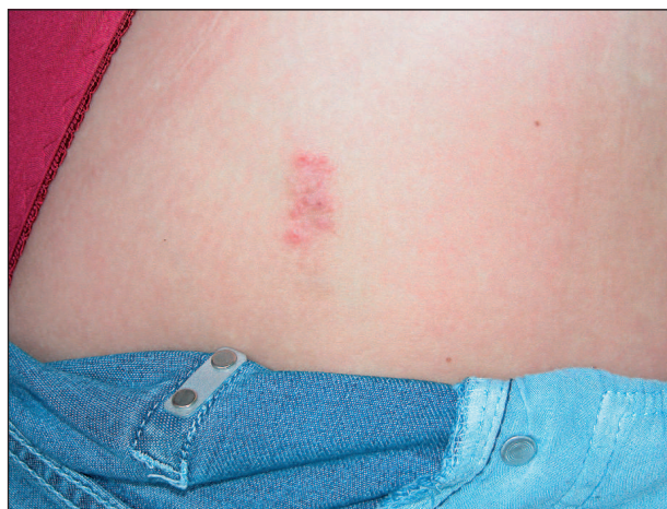
Obr. 1. Kontaktní alergie na nikl, klinický obraz, otisk čvoků džínů.