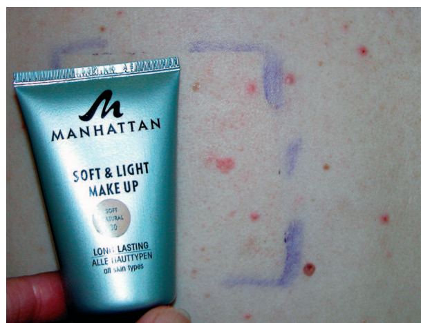
Obr. 4. Epikutánní test s kosmetikou – kontaktní alergie v testu.