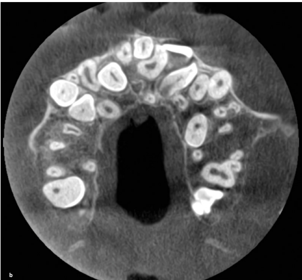
Obr. 1 Pacientka (12 let) s kleidokraniální dysplazií. V horní čelisti je přítomno dvanáct a v dolní čelisti osm nadpočetných zubů. Ortopantomogram (a) a horizontální řez horní čelisti na CBCT snímku (b).