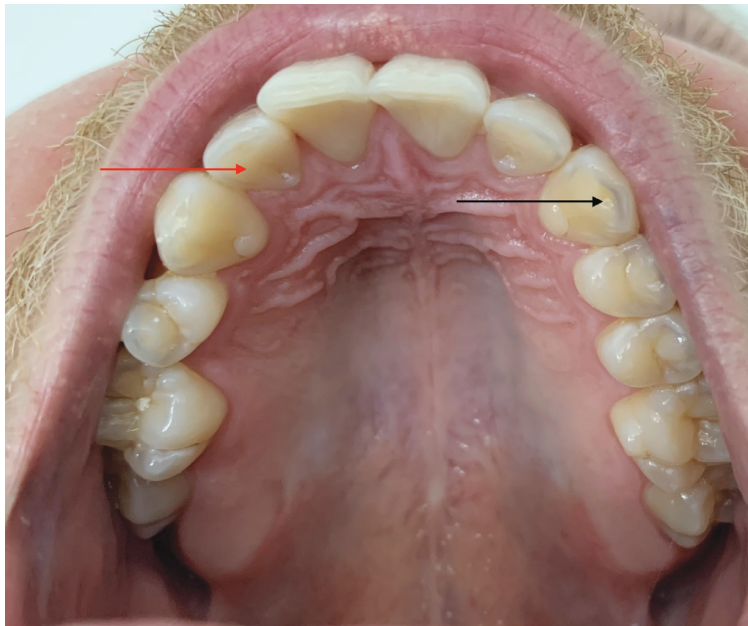
Obr. 5 Ztráta skloviny na palatinálních ploškách zejména horních frontálních zubů (červená šipka). Postižení okluzní plošky, miskovitý defekt (černá šipka)