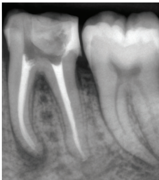
Obr. 4 Koreňové kanáliky zaplnené polyepoxidovým sealerom AD Seal™ a gutta-perčou

kultúru E. faecalis neovplyvnil vôbec [44, 45]. V testoch na blokoch dentínu, si však polyepoxidové sealery dokázali udržať svoju antibakteriálnu aktivitu približne konštantnú, a to minimálne po dobu jedného týždňa [67]. V týchto testoch sa taktiež ukázala ich schopnosť penetrovať do dentínových tubulov a ovplyvňovať tak kolónie E. faecalis v hĺbke 300 µm od steny koreňového kanálika [9].