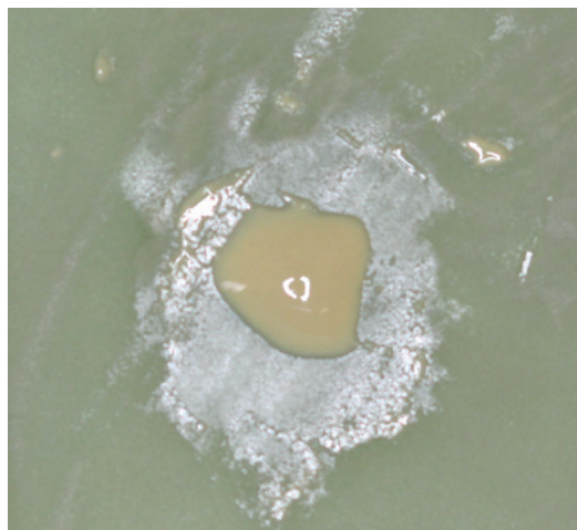
Obr. 2 Čerstvo namiešaný polyepoxidový sealer AH26® Silverfree

Hexametylén tetraamín – pôvodné zloženie polyepoxidového sealeru, komerčne známeho pod názvom AH 26®, (DENTSPLY De Trey, GmbH, Konstanz, Nemecko), ktorý obsahoval hexametylén tetraamín ako jednu zo svojich základných zložiek, bolo príčinou vyššej rozpustnosti tohto materiálu, kedy dochádzalo k degradácii hexametylén tetraamínu na amoniak a formaldehyd. Novšia generácia,