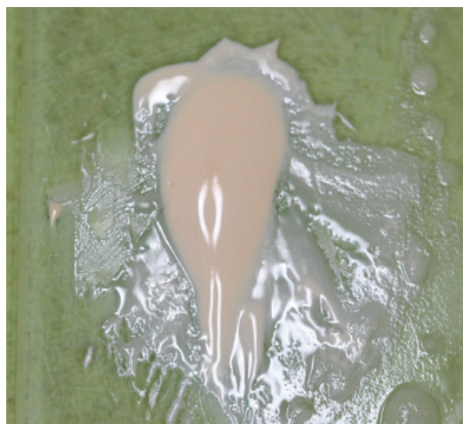
Obr. 3 Čerstvo namiešaný polyepoxidový sealer AD Seal™