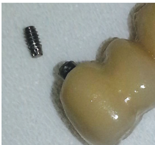
Obr. 2 Vybařený prasklý fixační šroubek spolu se suprakonstrukcí