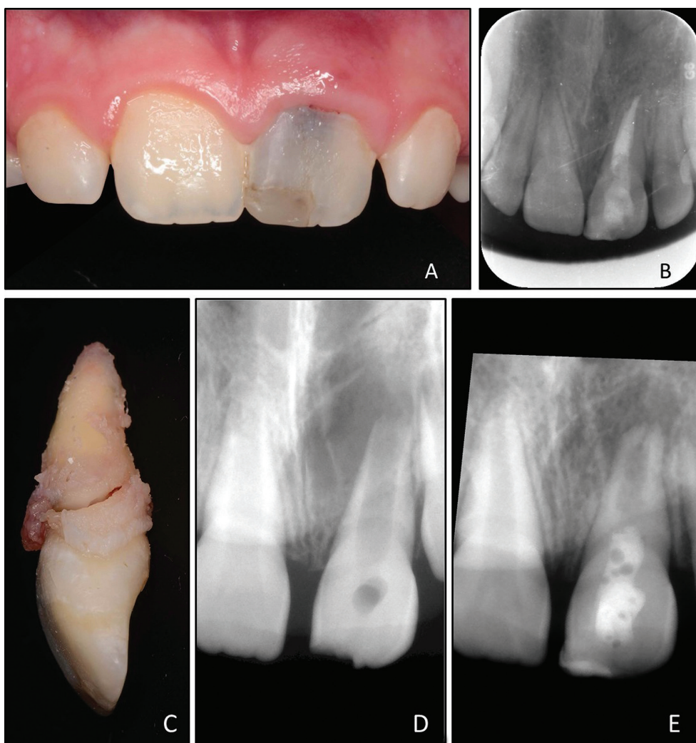
Obr. 1 A Fotografie klinického stavu 21 měsíců po dokončení endodontického ošetření zubu 21; je přítomna šedavá dyskolorace klinické korunky; B intraorální rentgenový snímek v apikálním zastavení 21 měsíců po endodontickém ošetření; C extrahovaný zub 21 s horizontální frakturou kořene; D upravený diagnostický rentgenový snímek zubu 21 před ošetřením maturogenezí; E upravený intraorální rentgenový snímek zubu 21 před endodontickým ošetřením