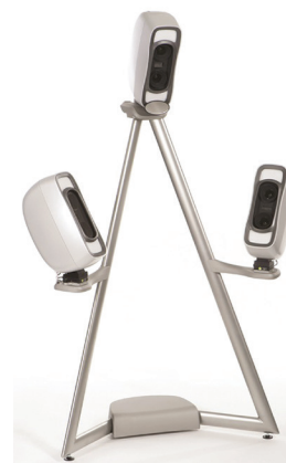
Obr. 1 Optický skener Vectra M3

• Strukturované světlo. Skenery využívající strukturované světlo promítají na snímaný objekt organizované vzorce bílého světla v podobě mřížek, teček nebo proužků. Současně je daný objekt fotografován kamerou, která je kalibrována na určitý typ vzorce. Tato kamera zachytí deformaci, vzniklou na povrchu objektu, a speciální software z této informace vytvoří výslednou 3D strukturu. Tato metoda je vhodnější pro menší objekty. Pro výzkum lidské tváře je již potřeba snímání ze dvou úhlů pohledu [17, 19].