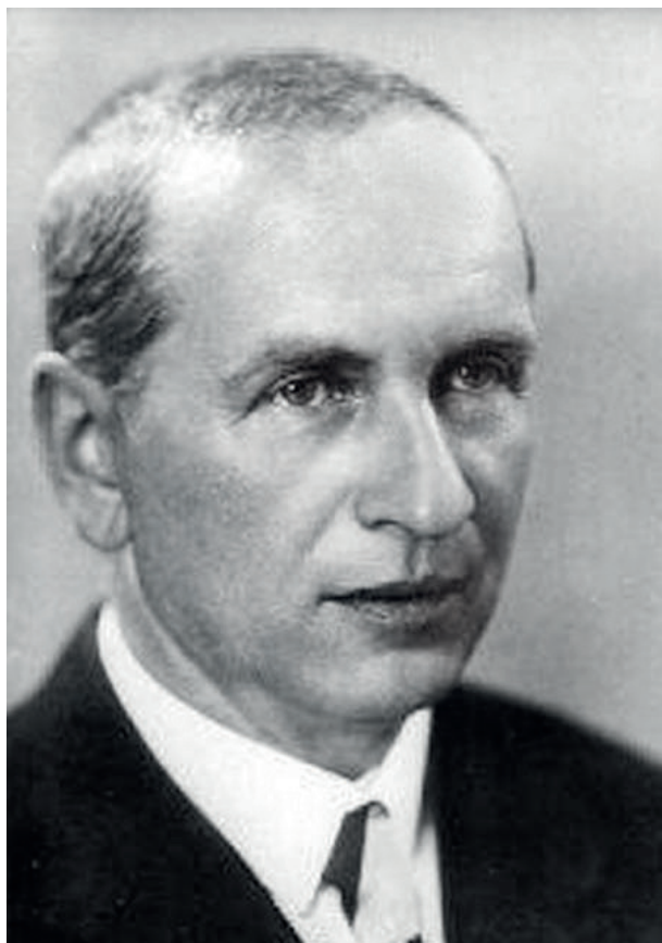
Obr. 1 Jaroslav Durych

Obléci se do uniformy byla, pro mladého Durycha nejschůdnější možnost jak si zajistit studium na univerzitě. V dětství ztratil záhy matku a o výchovu více než-li jeho otec, který se znovu oženil, pečovali příbuzní. Pobožná babička zařídila svému vnukovi studium na arcibiskupském konviktu v Příbrami – jejím přáním totiž bylo, aby se Jaroslav stal knězem. Tato životní dráha se však ani trochu Durychovi nelíbila, i když pocházel z katolické rodiny a Karel Čapek ho dokonce později nazval militantním katolíkem. Durych studia v Příbrami opustil a pro úplnost dodejme, že opuštěním konviktu předešel svému