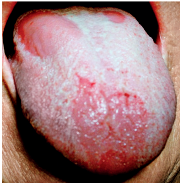
Obr. 8 Povlak jazyka patologicky zmnožený. Jeho olupovanie sa deje na väčších plochách na hrote a na tele jazyka. Stav imituje mapovitý jazyk.

PRAKTICKÉ ZUBNÍ LÉKAŘSTVÍ, ročník 65, 2017, 4, s. 49–54