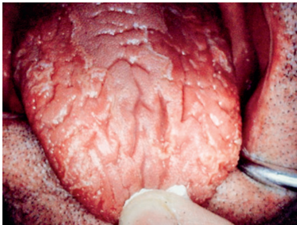
Obr. 1 Výskyt brázd na povrchu jazyka, imitujúce povrch mozgu (v starej terminológii lingua cerebriformis), bez prítomnosti povlaku jazyka (foto Ďurovič)

Praktické skúsenosti potvrdzujú, že povrchové nálezy nevyvolávajú žiadne ťažkosti. Odtiaľ pochádza stanovisko, že nález nie je potrebné liečiť. Skúsenosť však potvrdzuje, že vekom sa stav môže zhoršovať a pacienti si začínajú sťažovať na striedavé pálenie jazyka, ktoré je väčšinou vyvolané potravou alebo iným mechanickým podráždením [11]. Pocity pálenia krátko trvá a nedosahuje väčšiu intenzitu.