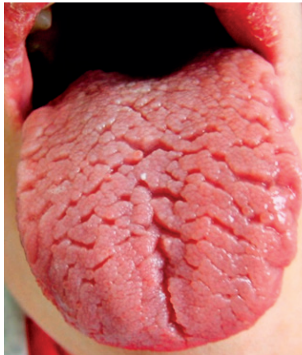
Obr. 2 Brázdy sú na celom tele jazyka a porušujú celistvosť aj smerom na hrany jazyka

Hlboké brázdy, ktoré vytvárajú laloky, sa stávajú aj rezervoárom tkanivového detritu a zvyškov potravy. V brázdach vznikajú druhotné povrchové zápaly, ktoré zvyšujú stupeň pálenia a pribúda aj slabá bolesť. Pri výskyte väčšieho počtu brázd môžeme na ich okrajoch pozorovať slabé červené farebné zmeny, ktoré svedčia pre regeneráciu filiformných papíl. Pri týchto stavoch sa môže vyskytnúť aj lingua geographica aj so svojou pridruženou symptomatológiou [4]. Pre objektivizovanie FT je vypracovaná metodika klinického vyšetrenia a hodnotenie stavu. Základ metodiky predstavuje sledovanie centrálnej brázdy na povrchu tela jazyka s nasledovnými kritériami: