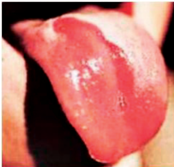
Obr. 4 Lingua geographica. Na tento povrch sa pridružuje povlak patologicky znmnožený a povrchová erózia na hrote jazyka

PRAKTICKÉ ZUBNÍ LÉKAŘSTVÍ, ročník 65, 2017, 2, s. 26–30