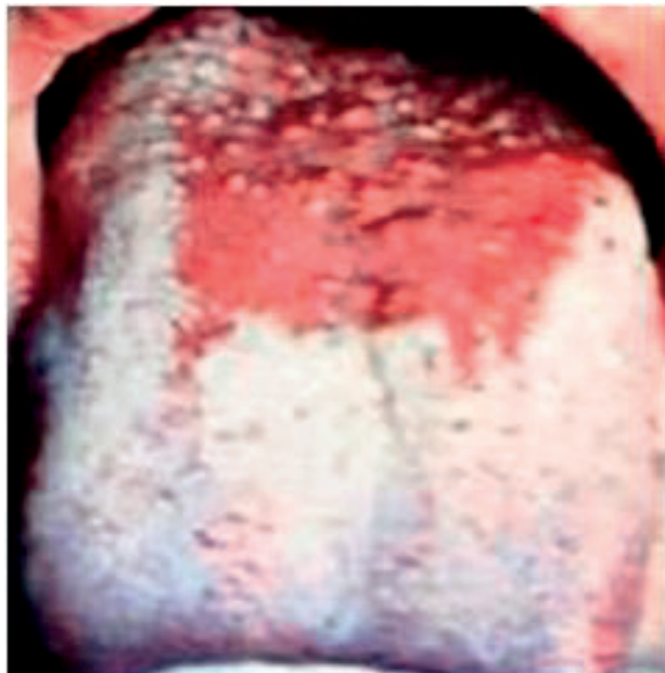
Obr. 6 Linqua plicata. Obmedzený počet rýh je lokalizovaný na tele jazyka. Rhyhy nie sú hlboké a stav nevyvoláva ťažkosti