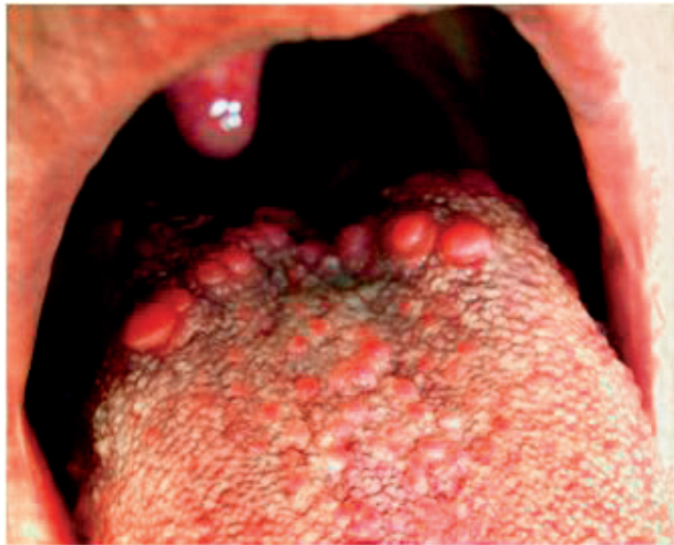
Obr. 9 Hyperplasticky a zápalovo zmenené papilae circumvallatae. Zápal postihuje aj chuťové poháriky a časť filiformných papil. Stav je u ezofageálneho refluxu (Tímková)

PRAKTICKÉ ZUBNÍ LÉKAŘSTVÍ, ročník 65, 2017, 2, s. 26–30