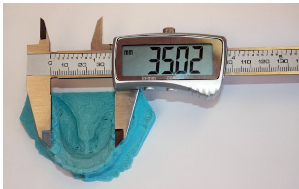
Obr. 3 Měření digitálním posuvným měřítkem na modelu získaném 3D tiskem

Měření prováděla dvakrát stejná osoba v intervalu jednoho týdne. Bylo použito digitální posuvné měřítko Festa (Čína) s přesností 0,01 mm (obr. 3). Celkem bylo získáno 120 údajů, které byly statisticky analyzovány.