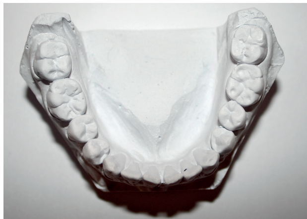
Obr. 1 Ztráta tvrdých zubních tkání na hrbolcích dolních molárů. Pravděpodobnou příčinou je kombinace faktorů – atrice v důsledku okluzních interferencí (klinickým vyšetřením byly zjištěny balanční a hyperbalanční kontakty na molárech) a koroze vzniklá konzumací kyselých jídel a nápojů (viz „cupping“ v oblasti hrbolků zubu 36) (pacient 25 let)

ce kořene a gingiválních recesů. Nevhodné okluzní zatížení může zhoršit průběh parodontitidy [3].