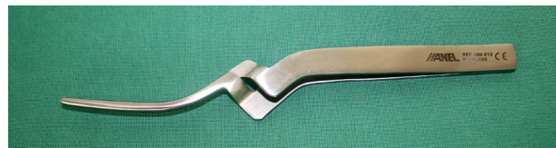
Obr. 2 Millerova pinzeta

V případě podezření na problémy související s okluzí je před vlastním vyšetřením chrupu namístě alespoň orientační vyšetření na odhalení temporomandibulárních poruch [11]. Touto problematikou