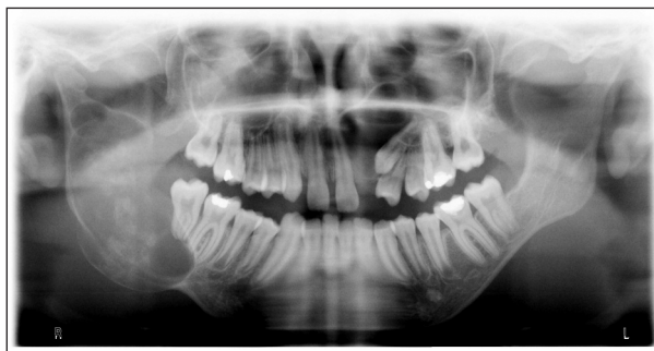
Obr. 1 Na OPG snímku patrná rozsáhlá cysta pravé větve mandibuly a folikulární cysta loco 23