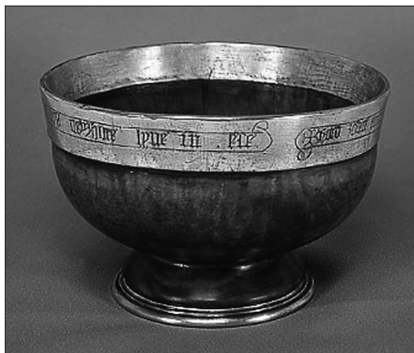
Obr. 1 Nádoba Mazer z javorového dreva s obrubami z pozláteneho striebra, pochádzajúca z roku 1380 [12]