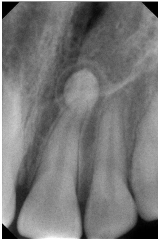
Obr. 3 Meziodens - RTG RVG

hlediska důležitá včasná diagnóza meziodentu, která umožní ještě minimální zásahy do organismu, a tím i jednoduchost zákroku. V literatuře se uvádí, že 80-90 % všech nadpočetných zubů se nachází v horní čelisti [12] a polovina z nich ve frontální části. Třetina pacientů s meziodentem má ještě další nadpočetné zuby [15].