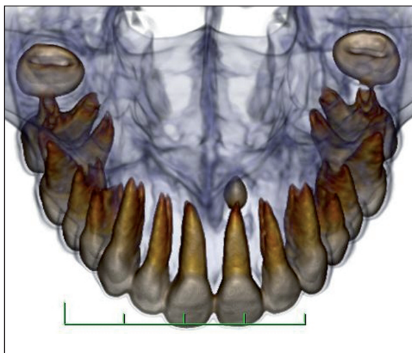
Obr. 1 Meziodens v CT obrazu z frontálního pohledu

Meziodens (obr. 1, obr. 2) je nejčastěji se vyskytující nadpočetný zub postihující 0,15-1,9 % populace [4]. Díky takto vysokému výskytu je třeba, aby zubní lékaři znali příznaky a známky přítomnosti meziodentu a jeho přibližnou léčbu (obr. 3). Důvod výskytu meziodentu není zcela znám i přes vědecké poznatky o vývoji dentální lišty a vlivu genetických faktorů [8]. Meziodens může způsobit opožděnou nebo ektopickou erupci stálých středních řezáků, které mohou ovlivnit vývoj a podobu okluze. Proto je z klinického