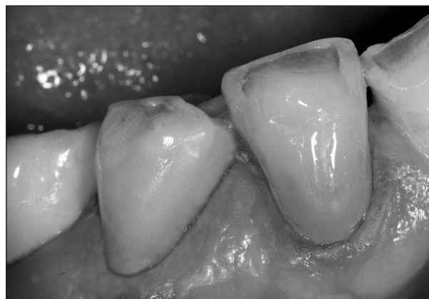
Obr. 2. Krčkové výplně u zubů 44-45 zhotovené adhezivní technikou.

sekund). Na adhezivní systém indikován pro rozsáhlost defektu kompomerní materiál (Dyract eXtra), který byl aplikován inkrementační technikou s maximální silou jedné vrstvy do 2 mm. Polymerace jednotlivých vrstev probíhala pomocí LED lampy SmartLite PS (20 sekund na jednu vrstvu). Pro opracování a dokončení výplně byla použita žlutá diamantová špička (JOTA) a doleštění proběhlo pomocí leštících disků Enhance. Po revizi výplně jsme shledali, že je plně funkční a esteticky vyhovující (obr. 2).