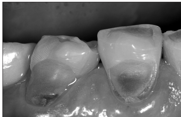
Obr. 1. Atrice způsobená třením zub o zub.

Kazuistika: Na zubech 44 a 45 byl při vyšetření diagnostikován atrici způsobený defekt (obr. 1). Po zešíkmení skloviny v koronální části defektu a toaletě kavity byl aplikován adhezivní systém VI. generace (Xeno III), ponechán volně po dobu 20 sekund, rozfouknut (2 sekundy) a polymerován polymerační LED lampou SmartLite PS (10