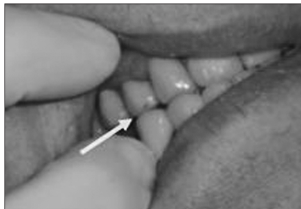
Obr. 1. Prasklina na 4 roky staré keramické korunce 14 objevená díky pigmentacím po okrajích. Vznikla patrně v důsledku kontaktu s keramickým protiskusem.

Značná část zubních lékařů v současné době upřednostňuje keramické materiály, a to především z estetických důvodů [7]. Keramika je ale už delší dobu považována za abrazivní materiál, který může zapříčinit značné opotřebení protistojících zubů a problematický je zejména v případech oprav, obzvláště povrchů, nebo když byla porušena glazura během úpravy artikulace [17] (obr. 1).