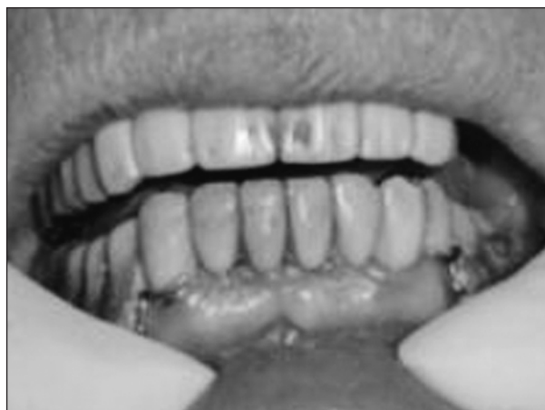
Obr. 4. Plastem fazetovaný můstek 22, 23, 24 po 3 letech, marginální gingiva bez známek zánětu.