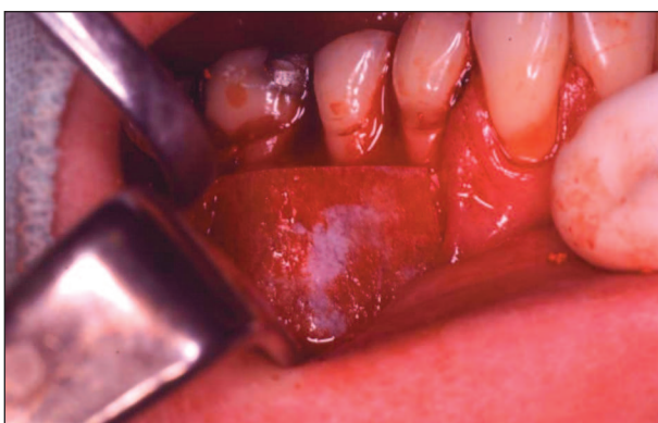
Obr. 6. Překrytí kostního defektu membránou HyproSorb. Fig. 6. Coverage of the bone defect with the HyproSorb membrane.