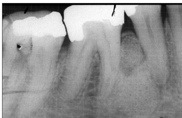
Obr. 8. Kontrolní rtg snímek s rastrem po augmentaci. Fig. 8. A control X-ray picture with a grid after augmentation.

cysty (obr. 2). Poté jsme uchopili vak cysty chirurgickou pinzetou, raspatoriem ho postupně odloučili od kosti a cystu exstirpovali. Exkochleární lžičkou jsme řádně vyčistili dutinu kosti, vypláchli fyziologickým roztokem a zkontrolovali (obr. 4). Po odstranění vaku bylo patrné, že došlo také k usuraci linguální lamely alveolární kosti. Cystickou dutinu jsme vyplnili augmentačním materiálem Poresorb (obr. 5) a překryli membránou HyproSorb (obr. 6). Po repozici mukoperiostálního laloku jsme ránu uzavřeli matracovými a jednoduchými stehy Prolenem (obr. 7). Vak cysty jsme odeslali na histologické vyšetření. Pacientku jsme poučili o hygieně a zhotovili kontrolní snímek s rastrem po augmentaci (obr. 8). Stehy jsme odstranili 10. den. Při kontrole byla pacientka bez potíží, rána klidná, s malou dehiscencí v oblasti krčku zubu 44. Při další kontrole za 2 měsíce však došlo ke ztrátě vitality zubu 45 a bylo nutné jeho endodontické ošetření. Dehiscence byla zcela zhojena a pacientka neměla žádné potíže. Podle histologického vyšetření byly v preparátu zastíženy struktury keratinizované-