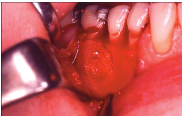
Obr. 5. Cystická dutina vyplněná augmentačním materiálem Poresorb. Fig. 5. Cystic cavity filled with augmenting material Poresorb.