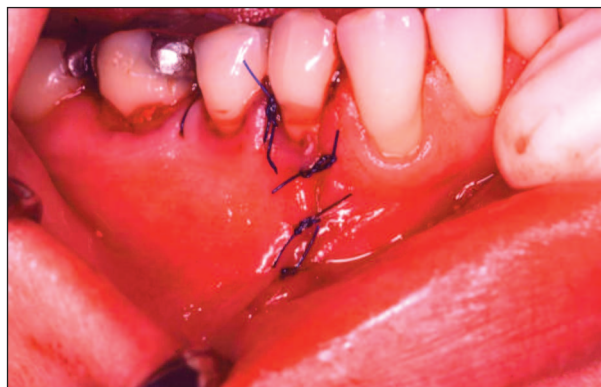
Obr. 7. Stav po repozici a sutuře mukoperiostálního laloku. Fig. 7. Condition after reposition and suture of mucoperiosteal lobe.